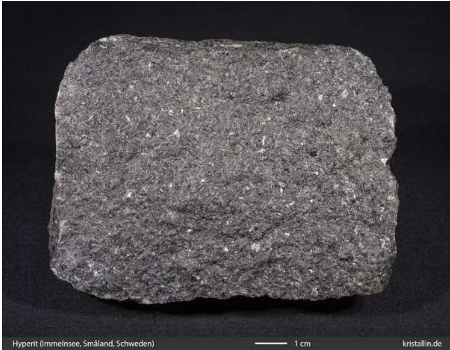
Hyperit (Immelensee, Småland, Schweden)