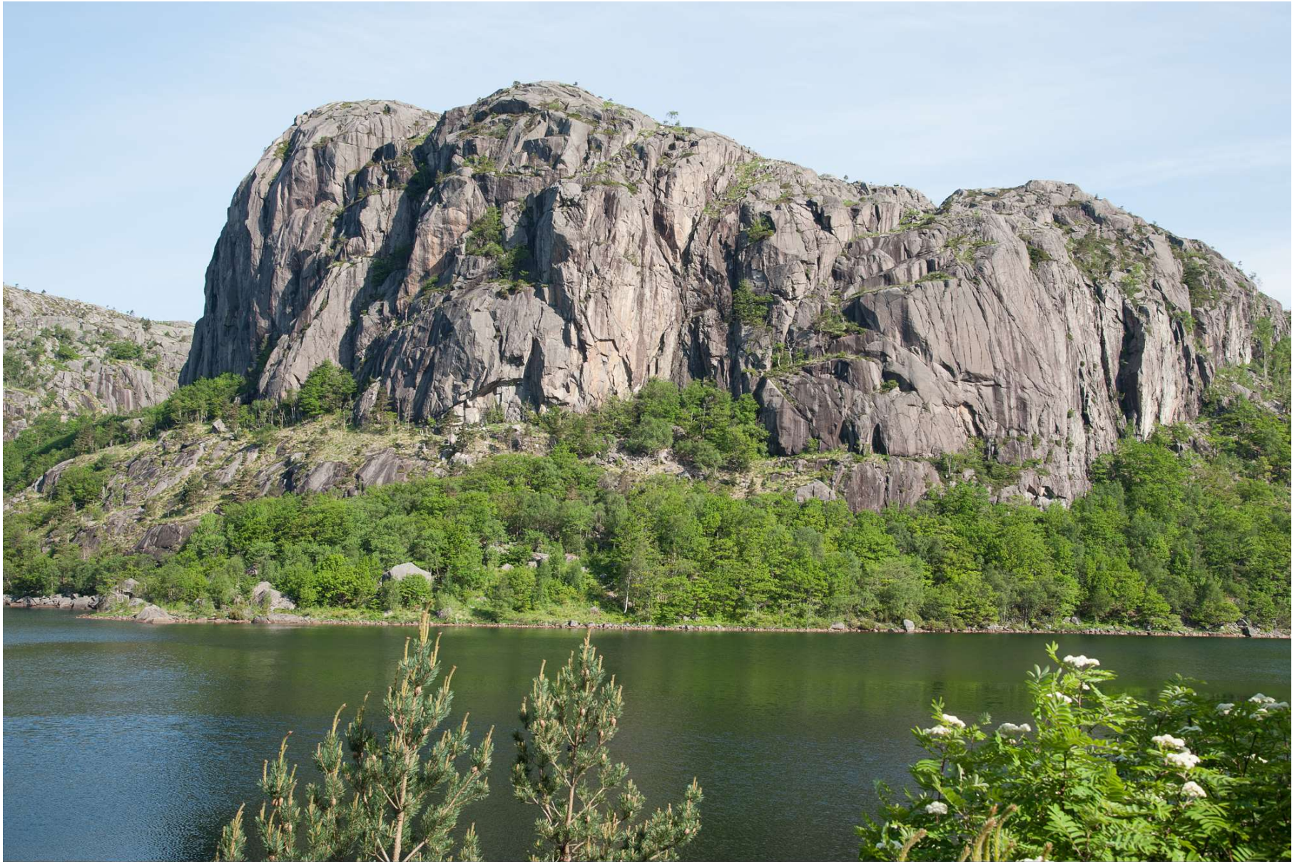
Rogaland in Norwegen - eine Landschaft aus Plagioklas