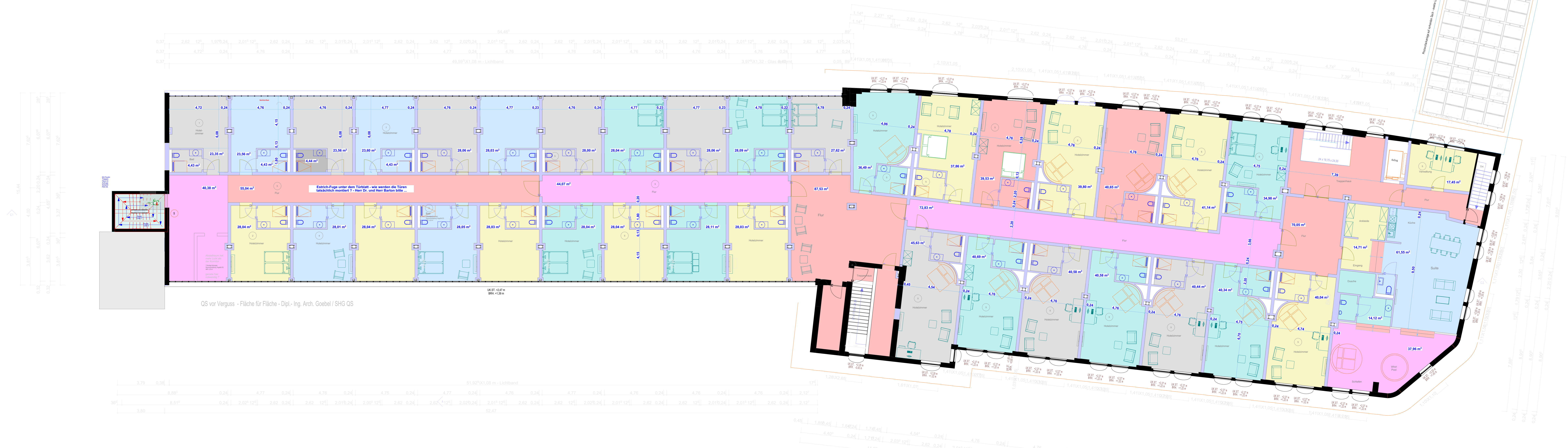
QS vor Verguss - Fläche für Fläche - Dipl.-Ing. Arch. Goebel / SHG QS