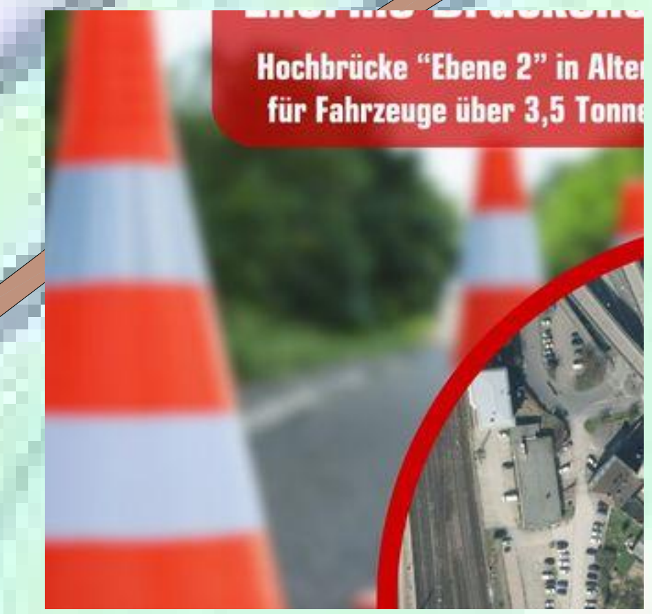
Hochbrücke "Ebene 2" in Alter für Fahrzeuge über 3,5 Tonne