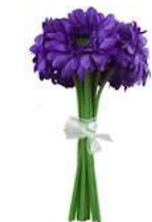
Flowers for you.jpg 8K