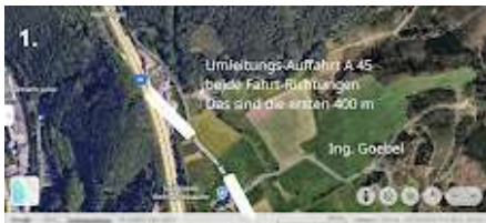
1-3_A 45 Umleitung Brunsbecke Abfahrt.jpg 706K