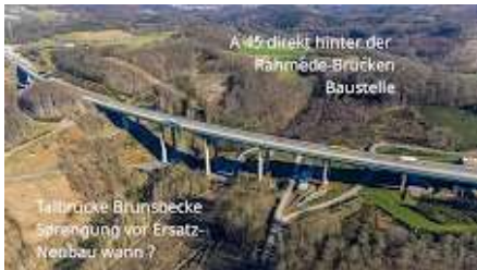
Brücke Brunsbecke A45.jpg 619K