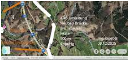
3-3_A 45 Umleitung Brunsbecke Auffahrtl.jpg 736K