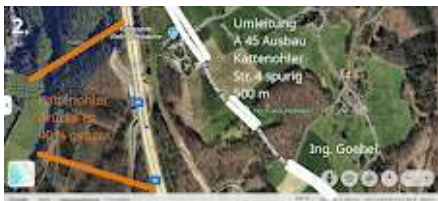
2-3_A 45 Umleitung Brunsbecke Mittelstück Kattenohl.jpg 723K