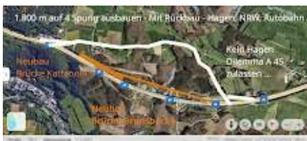
Umfahrung Brücke Brunsbeckel.jpg 770K